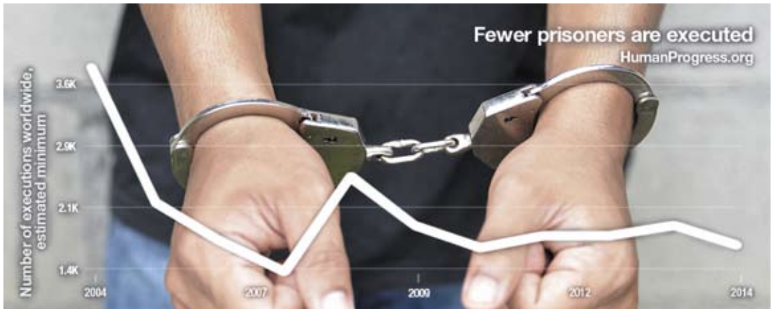
MINDER GEVANGENEN WORDEN GEËXECUTEERD

dat mensen alleen overeind komen indien ze door angst en wanhoop worden aangedreven. Bewust stoken ze het vuurtje van het onheil op en spreken over crisis, ondergang of Apocalyps om ons tot actie aan te zetten. Ze beseffen niet dat dit uiteindelijk leidt tot hulp- en actiemoeheid of onversneden fatalisme. 'Wat we ook doen, het helpt allemaal toch niet.'