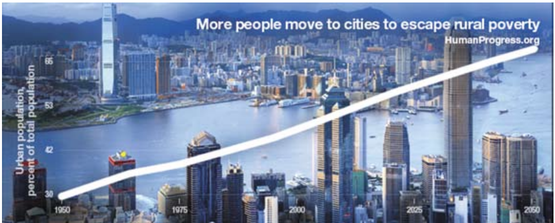
MEER MENSEN TREKKEN NAAR DE STAD OM AAN ARMOEDE TE ONTSNAPPEN

niet veel anders zijn dan 'ja'. In 2015 werden in Nederland zo'n 50 duizend asielzoekers opgevangen door het COA. Dat waren er ongeveer net zoveel als in 2003.