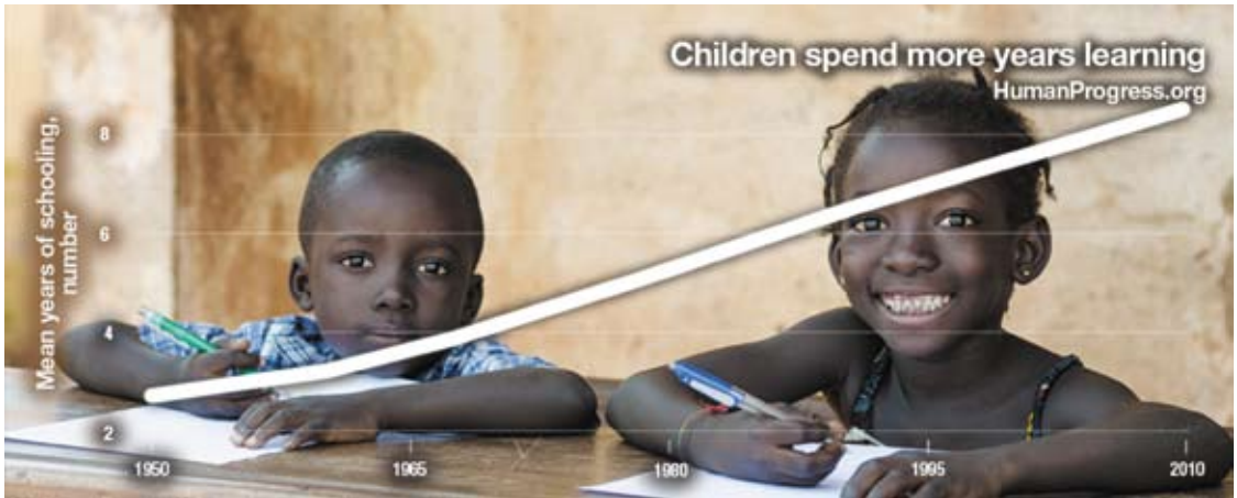
KINDEREN ZITTEN VEEL LANGER OP SCHOOL

sociale media steeds meer met elkaar spreken, en door het feit dat mensen steeds dichterbij elkaar in steden gaan wonen, wordt de gemeenschap van ideeën en praktijken sterk gestimuleerd. Deze kruisbestuiving leidt tot meer kennis, meer handel en meer rijkdom wereldwijd. Geen wonder dat de wereld steeds sneller verandert en verbetert.