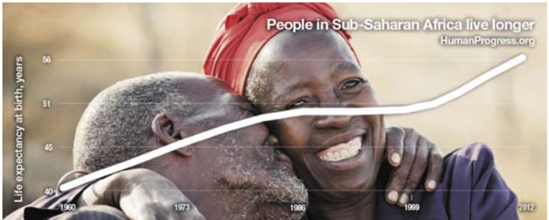
MENSEN IN SUB-SAHARA AFRIKA WORDEN STUKKEN OUDER

Wereldoorlog, 1 op de 47 rond 1973 of 1 op de 192 in 2001, dan viel het met 1 op de 350 in 2015 reuze mee.